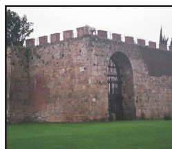
STADSMUREN finns kvar i Pisa.

Den äldsta byggnaden är katedralen, Duo-