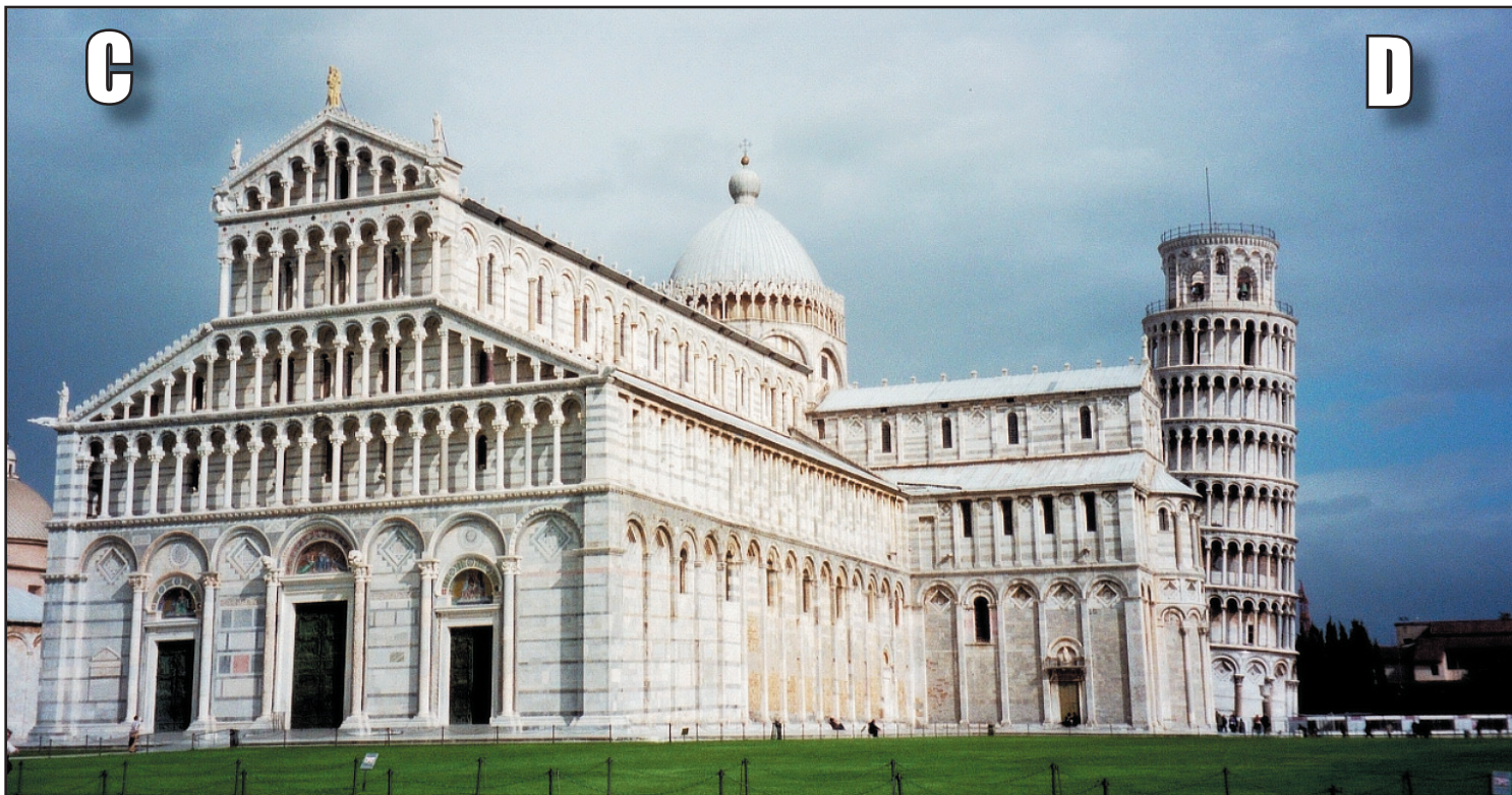
KATEDRAL OCH KLOCKTORN. Katedralen i Pisa med sitt berömda lutande klocktorn.