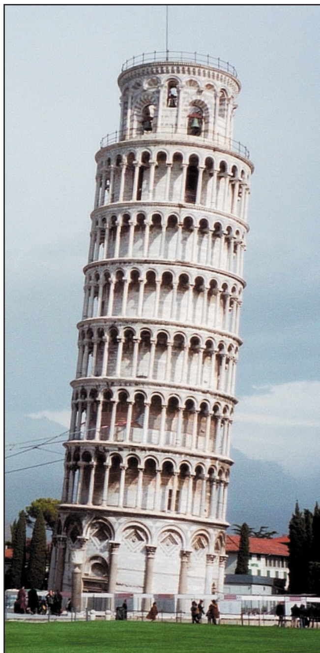
POPULÄRT FIASKO. Det lutande tornet i Pisa började luta efter bara några månaders bygge.

Man hade bara konstruerat tre våningar på klocktornet i Pisa när det började luta.