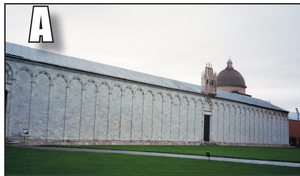
KYRKO GÅRDEN Camposanto byggdes redan 1278.

Om du besöker det lutande tornet så får du inte missa dess tre spännande grannar från medeltiden.