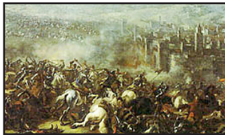
Det stora slaget år 1634.

Den nuvarande stadsmuren byggs och gör staden fyra gånger större.