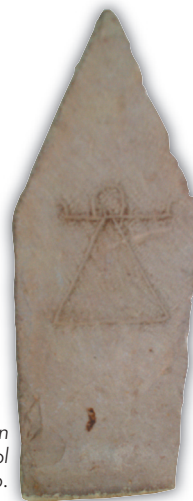
Gravsten med symbol för Kartago.

Staden har blivit förstörd så många gånger att man tappat räkningen.