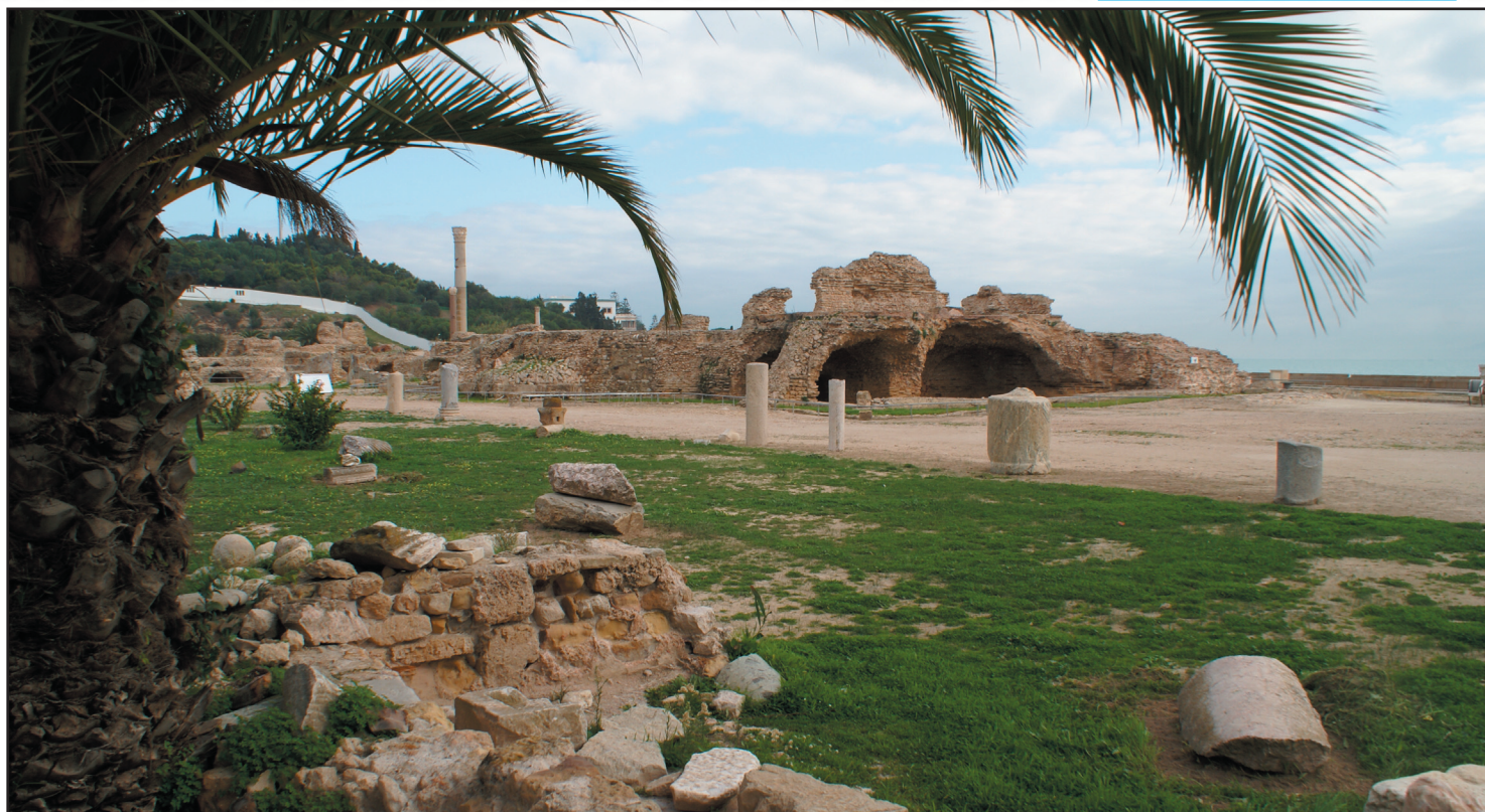
ROMERSKA RUINER. De bäst bevarade ruinerna i Kartago är från romar-riket. Bland annat kan du besöka det här badhuset.