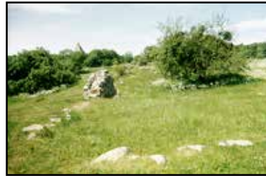
I dag är bara några murar synliga av det stora slottet.

SKOPINTULL. Det är ingen som vet var namnet på gravhögen Skopintull kommer från, betyder det "Skopes grav"? Eller var det här som kyrko-besökarna tog på sig skorna? Graven är 24 meter i diameter och 3 meter hög och grävdes ut 1917. Här brändes en medeltida man på sin båt tillsammans med sin häst samt flera hundar, kor och jaktfåglar. Man hittade också rester av kläder som smyckats med guld och bälten av en form som kommer från nuvarande Ukraina.