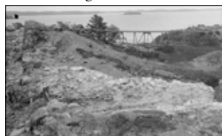
Ruinen av Alsnöhus under utgrävningen år 1918.

Alsnöhus attackeras, bränns ner och överges.