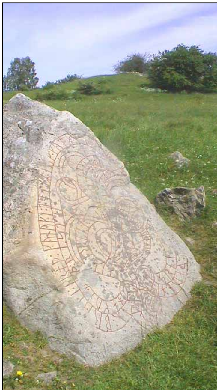
KUNGLIGA MINNEN. På runstenen i Hovgården används ordet "kung" för första gången i Sverige. I bakgrunden syns ruinerna av det medeltida slottet Alsnöhus.

I dag skyddas hela Hovgården som ett världsarv tillsammans med grannön Birka.