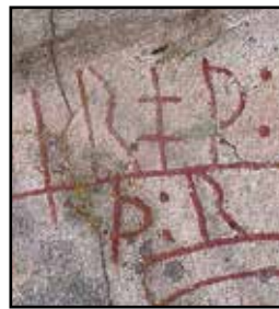
Närbild av några runor. Runsten U11.

Tolkningen av runinskriften: "Tyd du runorna! Rätt lät rista dem Tolir, bryte i Roden, åt konungen. Tolir och Gylla läto rista (dessa runor), båda makarna efter sig till en minnesvärd. Häkon bjöd rista."