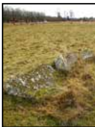
Tre liggande stenar.