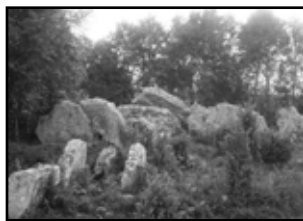
Den överväxta Girommen på 1930-talet.

För första gången börjar bönderna plöja upp gravfältet och använder marken till odling.