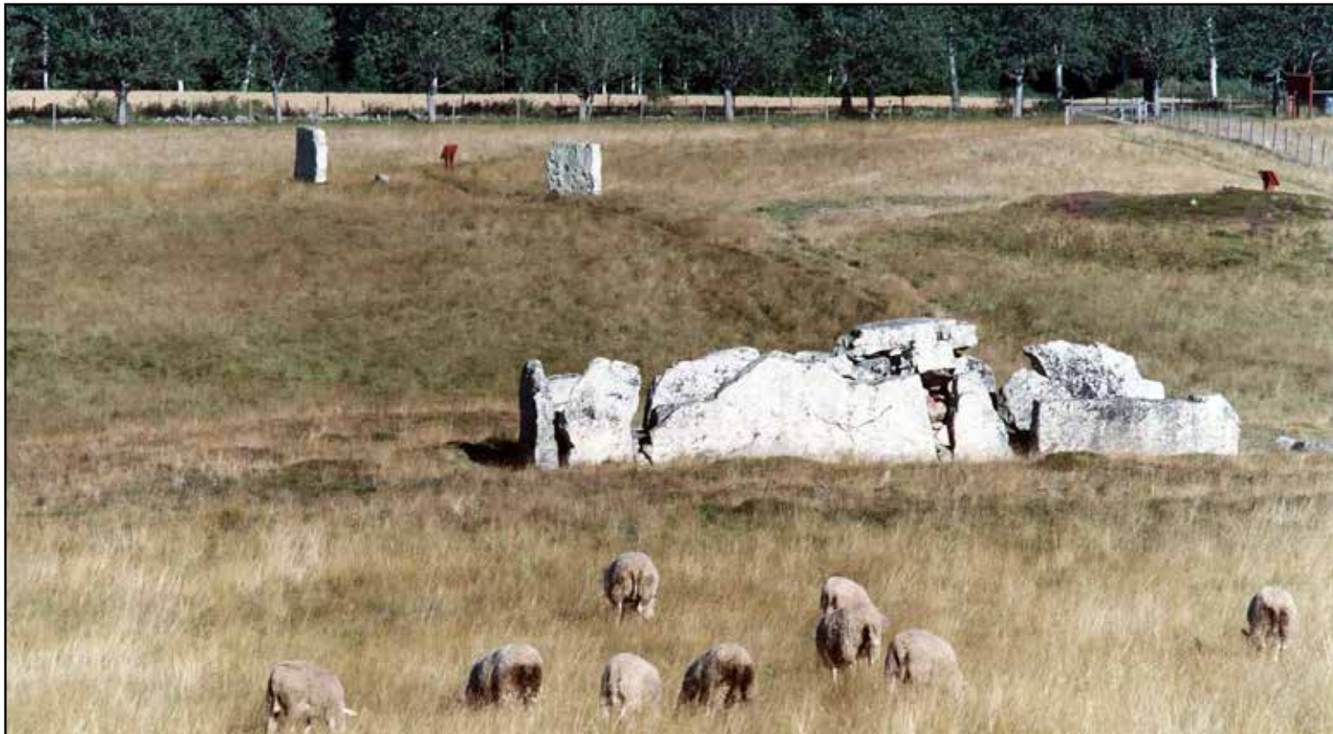
FORNFYLLT. Gravfältet Ekornavallen är fyllt av gravar och användes under flera tusen år av traktens invånare.