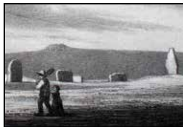
Brusewitz teckning från 1860.

TREUDD. Det här är en av de yngsta gravarna på Ekornavallen och är från vikingatiden. Den kan vara svår att se eftersom den bara sticker upp någon decimeter från marken men de tre sidorna är mer än 20 meter långa.