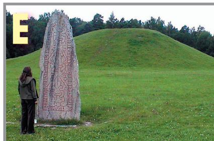
Runstenen framför Anundshögen.

En forntida hålväg går precis söder om den stora högen. Längs vägen finns 14 resta stenar (inkl runstenen). En arkeolog har upptäckt att man använde det gamla måttet "aln" (55 cm) när stenarna restes.