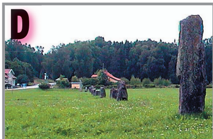
Raden med resta stenar sedd från nordost.