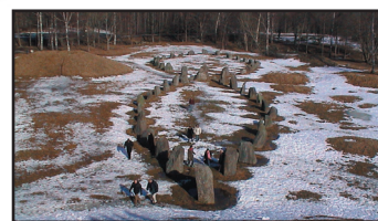
Utsikten från högen under vintern.

Men 1998 grävdes ett provschakt fem meter in i högen. Då hittade man rester av ett hus under högen