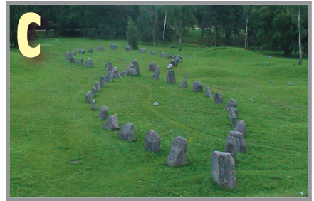
Skeppens sedda från Anundshögen.