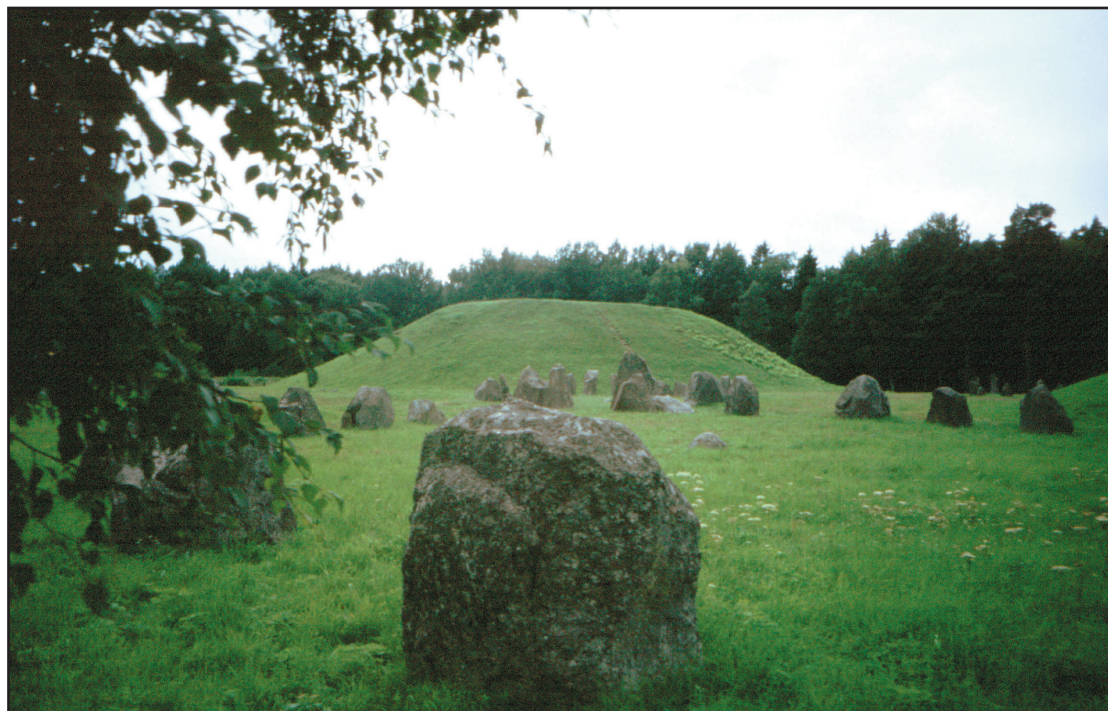
SVERIGES STÖRSTA. Anundshögen är nästan 70 meter i diameter vilket gör den till den största i Sverige.

Arkeologer undersöker området med markradar och upptäcker en rad gropar.