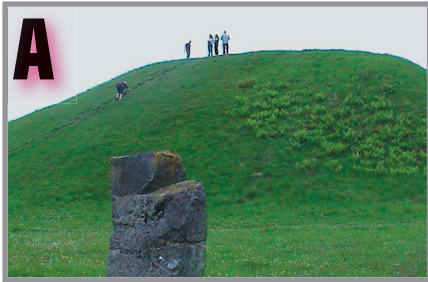
Anundshögen från nordost.