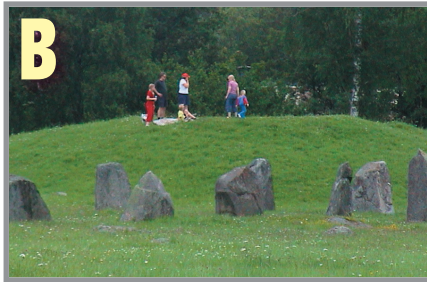
Picknick på den näst högsta högen.