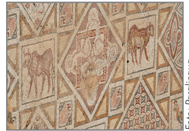
Mosaik. Från omkring år 300 var invånarna kristna i Jerash. Det fanns mer än 18 kyrkor. Många av kyrkorna hade vackra mosaiker.