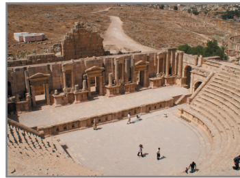
Södra teatern. Amfiteatern från år 90 har plats för 3 000 personer och används för konserter. Du kan också höra dagliga säckpipeuppvisningar.