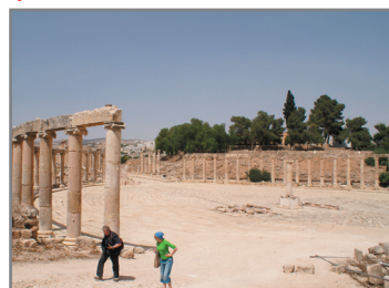
Forum. Torget med sina 160 kolonner dominerar ruinstaden. Dess ovala form är mycket ovanlig.