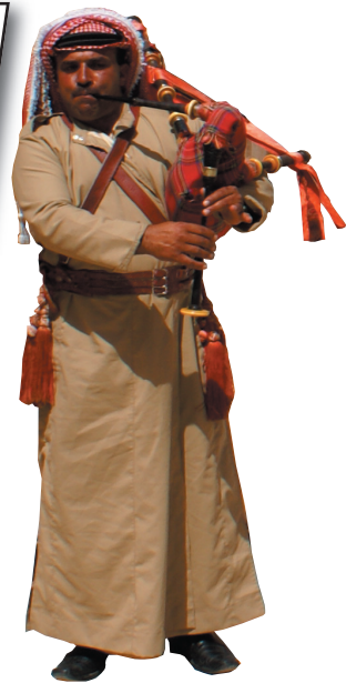
SÄCKPIPA. Varje dag görs säckpipe-uppvisningar i Jerash. Det är ett arv från tiden under brittiskt styre.

Stadens ruiner är i dag så kända att när man i arabvärlden vill beskriva att något fallit i ruiner säger "det är som ruinerna i Jerash".