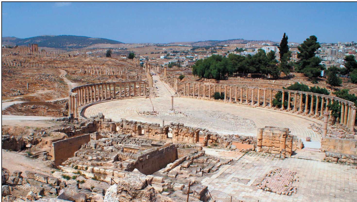
RUINERNA. Staden Jerash har en av världens bäst bevarade ruiner från romartiden.