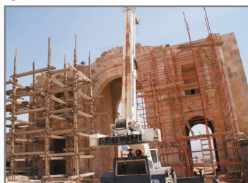
Hadrianus-porten. Den 37 meter breda triumfbågen byggdes år 129 inför kejsarens besök.