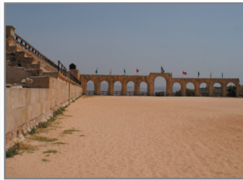
Hippodromen. Hästkapp- löpningsarenan var den minsta i romerska riket men hade ändå plats för 15 000 åskådare.

Den årliga kulturfestivalen hålls för första gången.