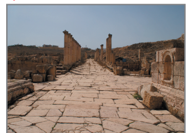
Cardo Maximus. Den gamla huvudgatan är 800 meter lång och hjulspåren från vagnarna syns än.